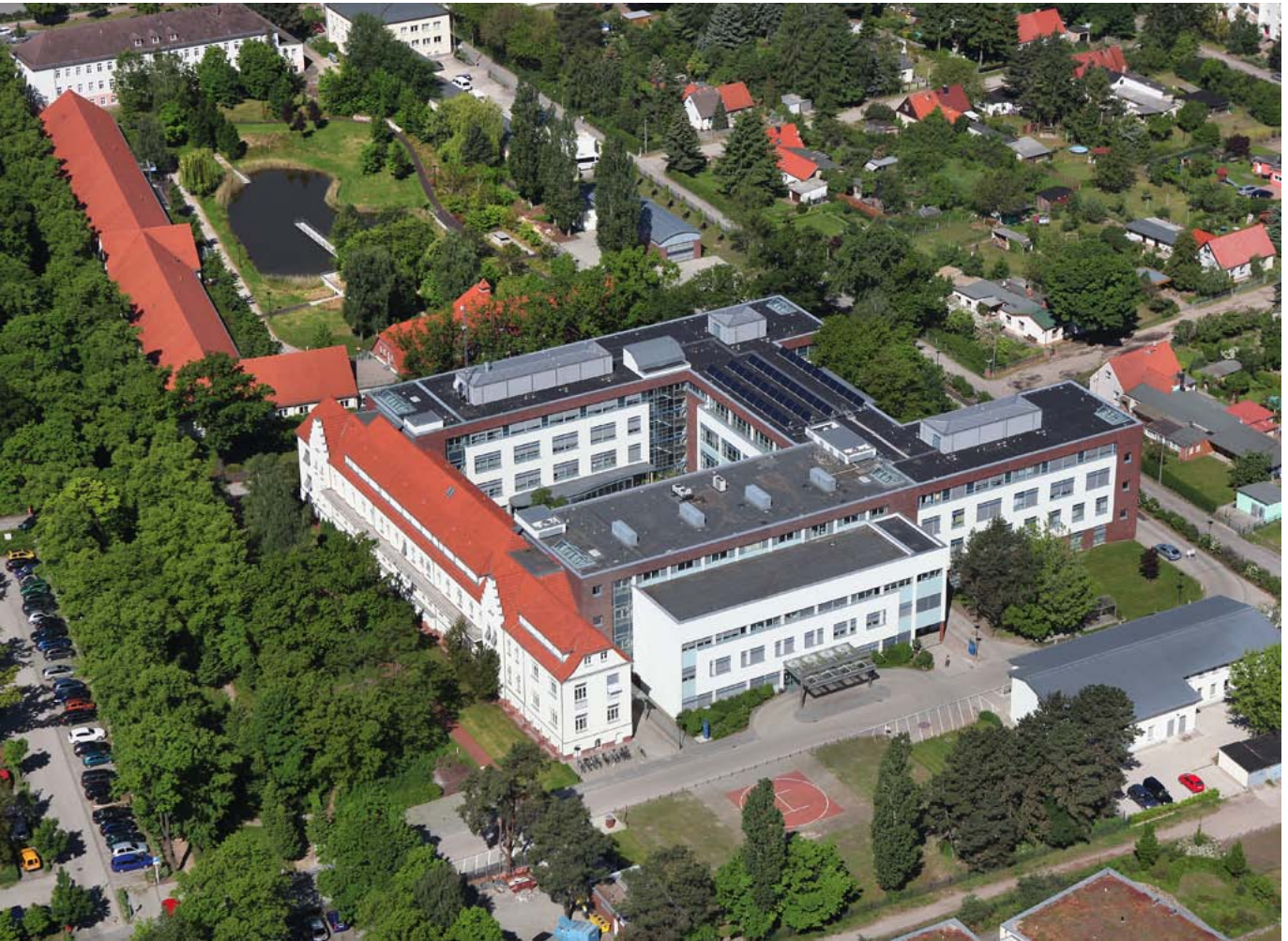
Abbildung: Luftbildaufnahme der Oberhavel Kliniken GmbH / Klinik Oranienburg