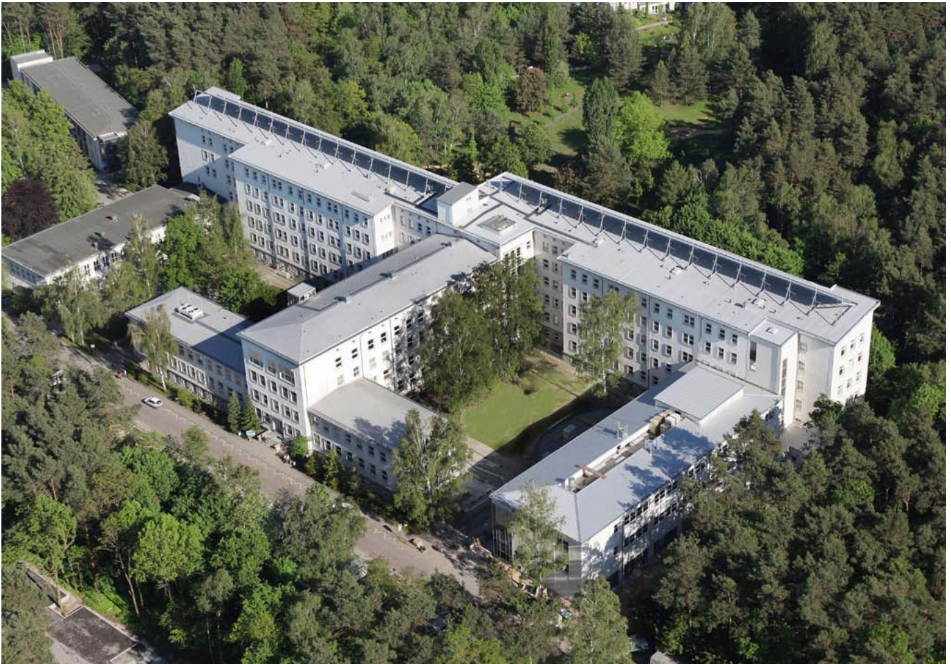
Abbildung: Luftbildaufnahme der Oberhavel Kliniken GmbH / Klinik Hennigsdorf