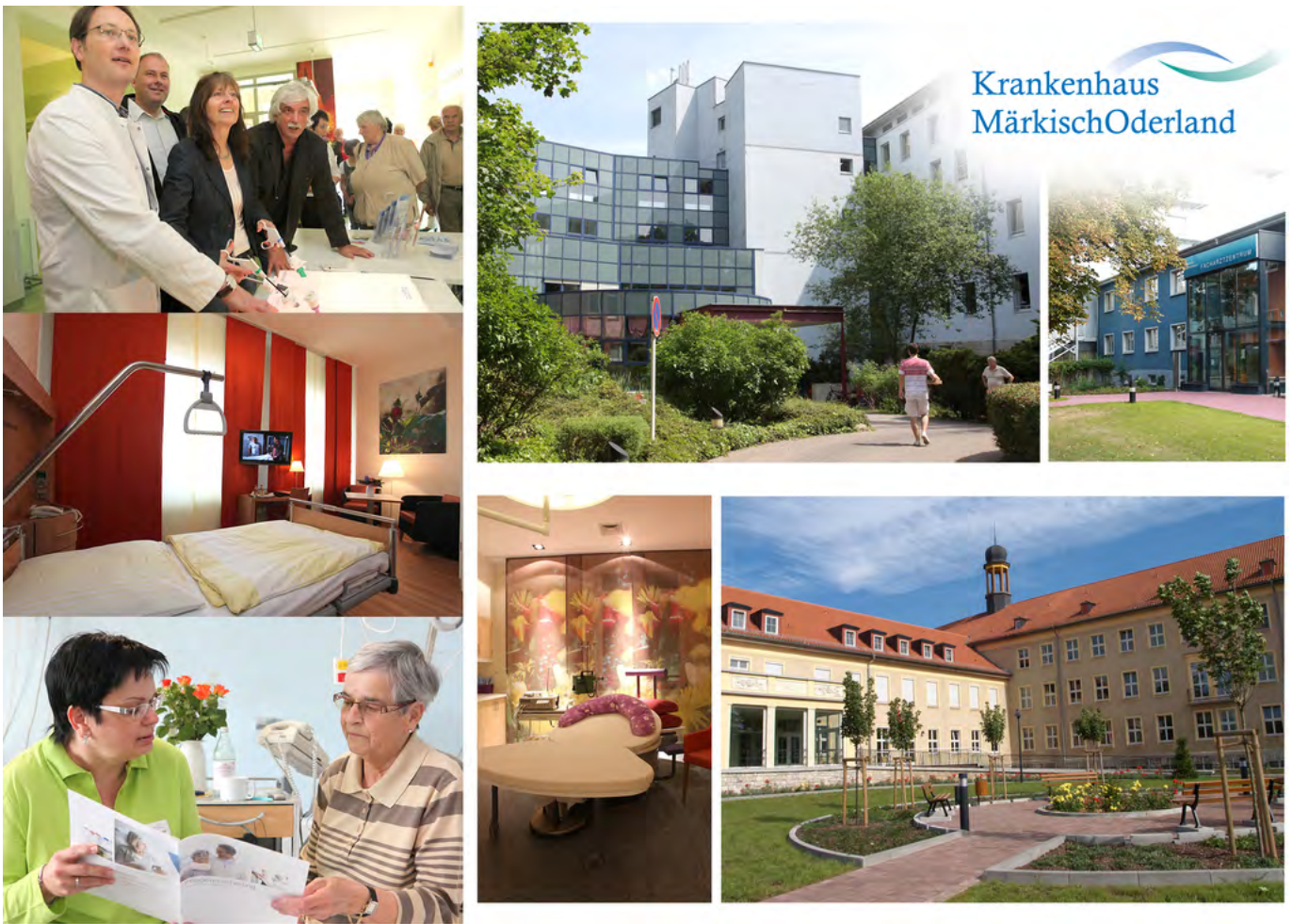
Abbildung: Krankenhaus Märkisch- Oderland

Qualitätsmanagement wird im Krankenhaus Märkisch Oderland GmbH als Führungsaufgabe und elementarer Bestandteil des Managements verstanden. Die Qualitätspolitik und Qualitätsziele basieren vollumfänglich auf dem Leitbild der Krankenhaus Märkisch Oderland GmbH. Hier sind klare und richtungweisende Zielvorgaben formuliert, an denen wir unser Handeln ausrichten. Im Fokus unserer Bemühungen steht immer der Mensch- als Patient, Angehöriger, Mitarbeiter oder Partner.