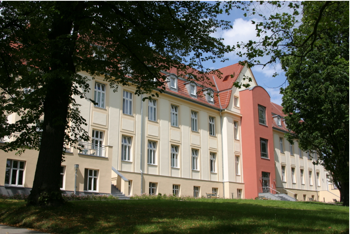
Abbildung: Epilepsieklinik Tabor Bernau

Seit über 50 Jahren werden in den Hoffnungstaler Anstalten Menschen mit Epilepsie fachkundig behandelt. Die Epilepsieklinik Tabor zählt zu den modernsten Behandlungszentren in Deutschland. Sie bildet den Brandenburger Standort des Epilepsiezentrums Berlin-Brandenburg. Im komplett sanierten Altbau des ehemaligen Bernauer Krankenhauses stehen 50 Betten in modern ausgestatteten Ein- und Zweibettzimmern mit jeweils eigenem Sanitärbereich zur Verfügung.