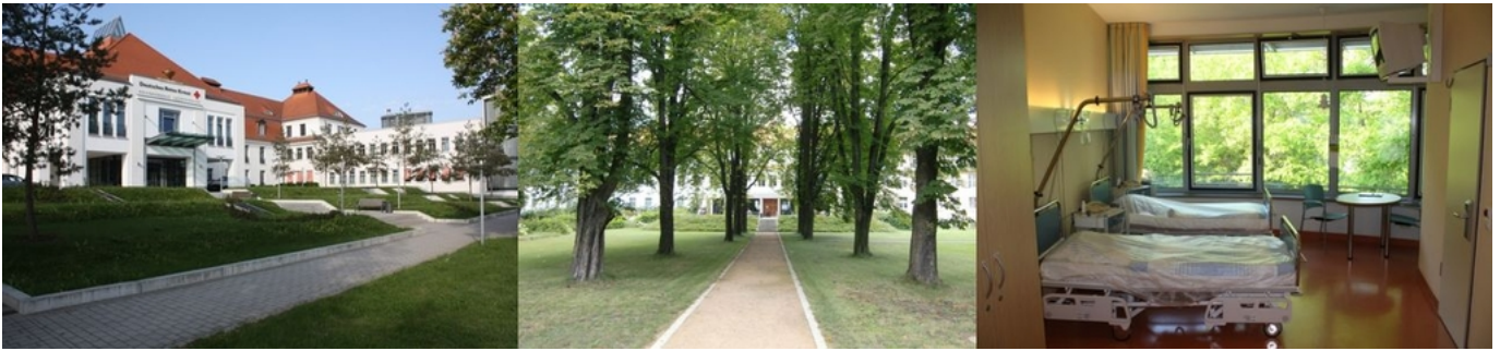
Abbildung: Ansichten des DRK Krankenhauses Luckenwalde